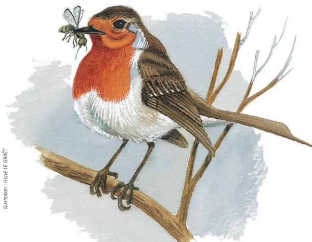
Illustration : Hervé LE GRACÉ

6- Le chemin sort bientôt de la forêt et traverse les champs : vous êtes sur « la grande voie ». Après une courte montée, celle-ci rejoint la petite route et vous ramène au village d'Aillienville.