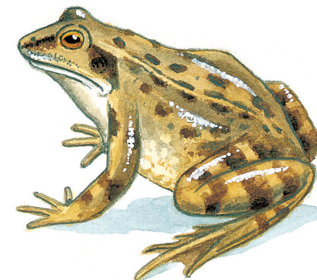
GRENOUILLE ROUSSE ( Rana Temporaria F. Ranidés )

Prendre à gauche la route goudronnée D269 puis à 200 mètres suivre le chemin à droite où vous découvrirez un superbe point de vue sur la vallée de l'Amance. Passer devant la maison forestière, puis devant le stade et derrière le cimetière et revenir à Varennes.