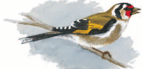
Illustration : Hervé LE GRAPET