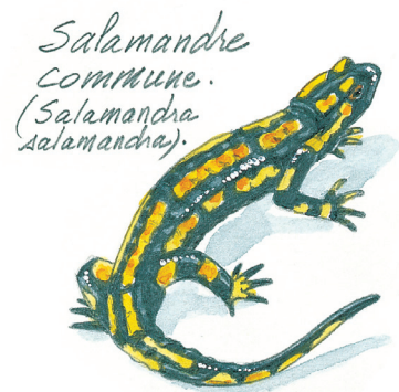
Illustration : Hervé Le Goret