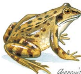
Grenouille rousse (Rana temporaria F. Raudolfs).