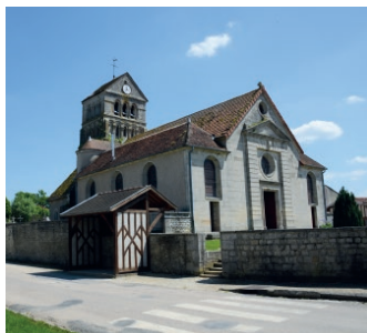
Eglise - Voillecomte