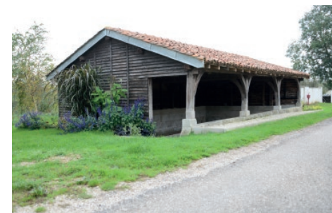
Lavoir - Voillecomte