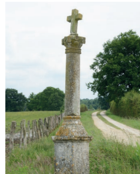
Calvaire - Voillecomte

Vous pouvez observer à droite le lavoir d'architecture champenoise, alimenté par la rivière. A la prochaine intersection, où se trouve à gauche un calvaire, poursuivez tout droit par la rue de la Croix et vous rejoignez en 1 km le point de départ en empruntant la D153.