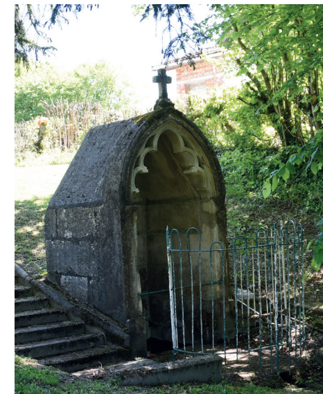
1 Fontaine Saint-Aubin.

3 - Vous longez la Marne pour atteindre Valcourt. Aux XVIII e et XIX e siècles le niveau d'eau de la Marne la rendait navigable. Le port de Valcourt approvisionnait Paris en bois et produits métallurgiques. Le fret était convoyé par « brelle », une sorte de radeau. L'ancre présente sur la place, en médaillon sur la façade de la mairie et celles visibles sur de vieilles tombes rappellent le passé marinier du village. En 1944 Valcourt a subi de gros dégâts dus aux bombardements alliés qui visaient la base aérienne occupée par les Allemands. Poursuivez vers Moëslains. C'est au VII e siècle qu'il est fait mention de Mediolanum défendu par de puissants seigneurs dont le château est érigé sur une bute. Au XVI e siècle lors de l'invasion espagnole menée par Charles Quint, un incendie dévasta Moëslains, excepté sa chapelle qui abritait une relique de saint Aubin, puis descendez le long de la Marne.