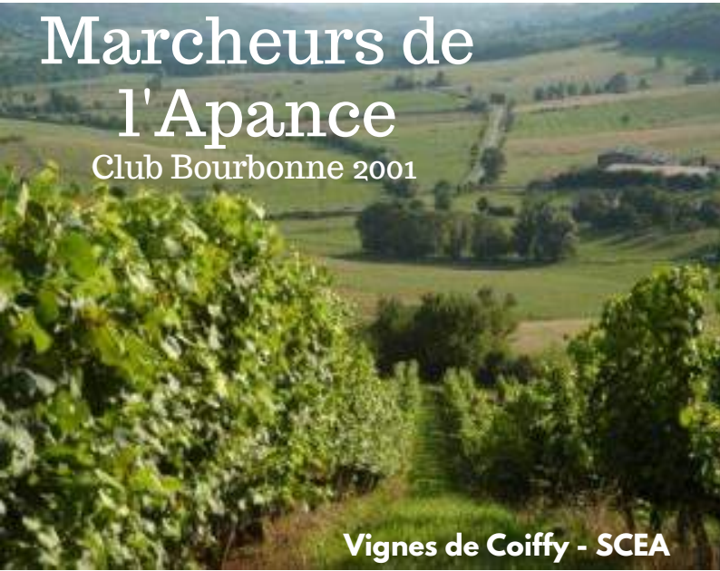
Vignes de Coiffy - SCEA

Marcheurs de l'Apance Club Bourbonne 2001