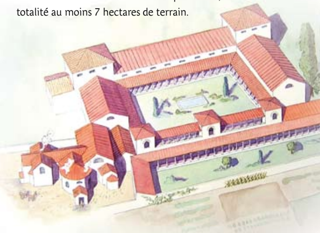
Evocation de la villa