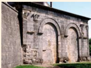
Porte romaine (Langres)