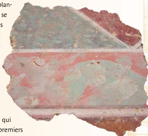
Fragment d'enduit peint (Andilly)

L'époque gallo-romaine, qui s'étend pendant les cinq premiers siècles de notre ère, a vu le développement d'une civilisation utilisant la pierre comme élément essentiel de construction. Révélés par des fouilles archéologiques, des vestiges en sont parvenus jusqu'à nous, à la ville comme à la campagne.