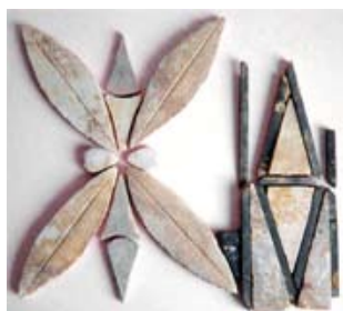
Décorations de sol en marbre

www.culture.gouv.fr/champagne-ardenne/2culture/musee-france/musee-art-hist.html