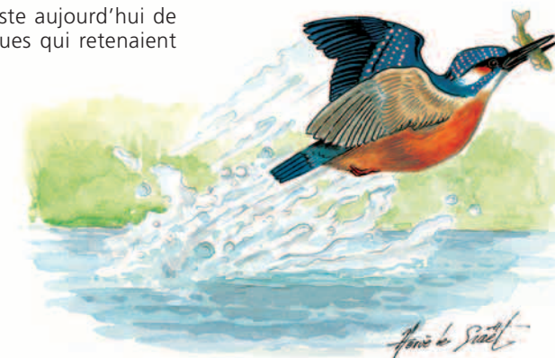
Illustration : Hervé LE GRAPET

5- Arriver à une petite route et tourner à droite. Passer sous le pont de la D25 et rejoindre le point de départ.