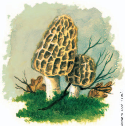
Illustration : Hervé LE GRÂET